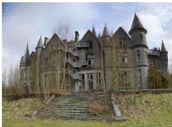
Houyet: chateau de Noisy

Traject: Houyet / Montgauthier / Forzée / Navaugle / Frandoux / Laboux / Briquemont / Rochefort / Hansur-Lesse / Belvaux / Auffe / Genimont / Lavaux-Sainte-Anne / Revogne / Pondrome / Beuraing / Martouzin / Neuville / Hour / Houyet